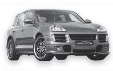
Схема подключения АвтоФон Контрол Porsche Cayenne – 2010

ВНИМАНИЕ: Данный модуль сопряжения предназначен исключительно для профессиональной установки. Неквалифицированное вмешательство в штатную электропроводку может привести к выходу из строя блоков электрооборудования автомобиля!